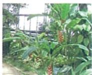
ヘリコニア・ロストラータ