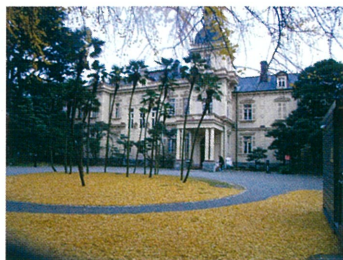
旧岩崎邸庭園 イチョウ絨毯