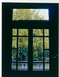
旧岩崎邸庭園洋館からの眺め