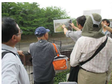
↑ 空堀川河道内調節池