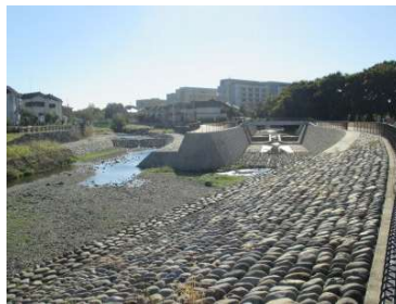
↑ 柳瀬川・空堀川新合流点