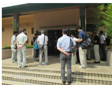
↑ 市立歴史民俗資料館

玉川上水駅（集合）→武蔵村山市立歴史民俗資料館→市立野山北公園→六地藏付近→滝の入不動尊→長圓寺→空堀川一級終点付近→横田トンネル・赤堀トンネル→大多羅法師の井戸→番太池→赤坂池→空堀川河道内調節池→武蔵村山市役所（意見交換）→上北台駅・玉川上水駅（解散）