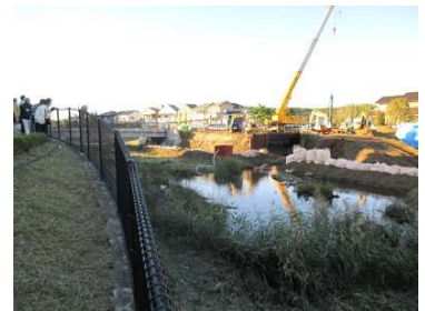
↑ 空堀川・奈良橋川合流点