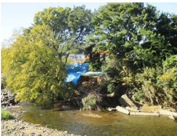
↑ 柳瀬川護岸被災箇所

清瀬駅（集合）→柳瀬川護岸被災箇所→金山調節池→柳瀬川・空堀川合流点→空堀川御成橋付近→空堀川・奈良橋川合流点→空堀川東芝中橋→空堀川芝中調節池→芝中調節池排水機場（意見交換）→上北台駅・玉川上水駅（解散）