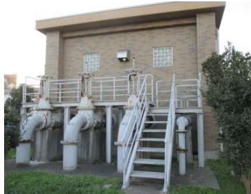
↑ 芝中調節池排水機場