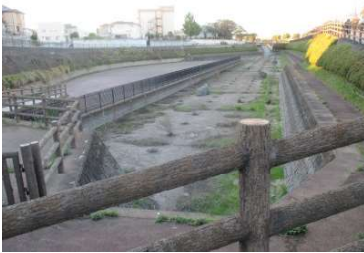
↑ 空堀川芝中調節池