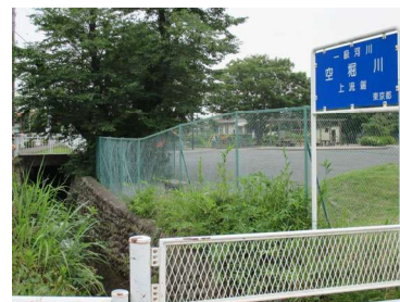
↑ 空堀川一級終点付近