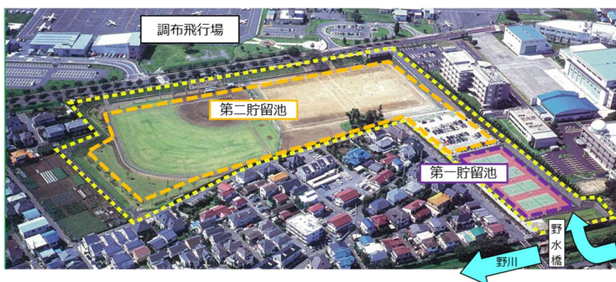
野川大沢調節池の全景

本工事では、既存調節池（掘込式）の第二貯留池を約3m掘り下げることで、現況の貯留量から約6.8万m 3 拡大し、完成後は約15.8万m 3 の貯留量を確保します。既に工事に着手しておりますが、現在供用中の調節池であることから、工事期間中も従来の洪水調節機能を確保しつつ、作業を進めています。