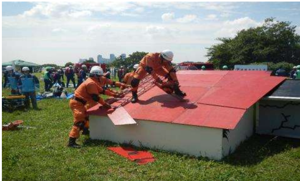
倒壊建物における救助活動訓練