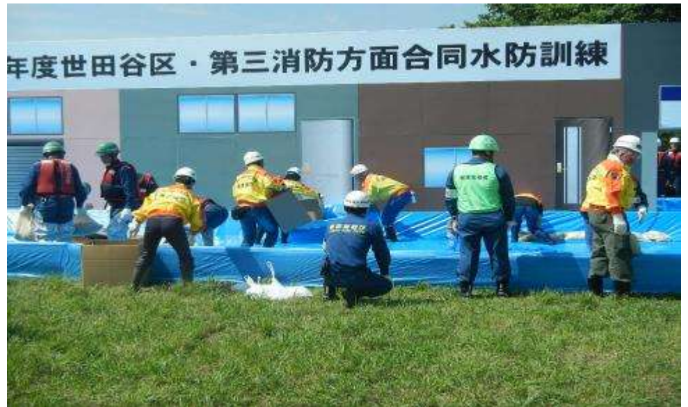
都市型水防工法訓練