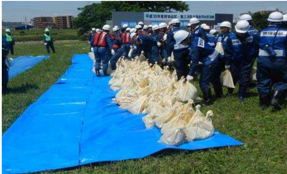
改良積土のう工法訓練