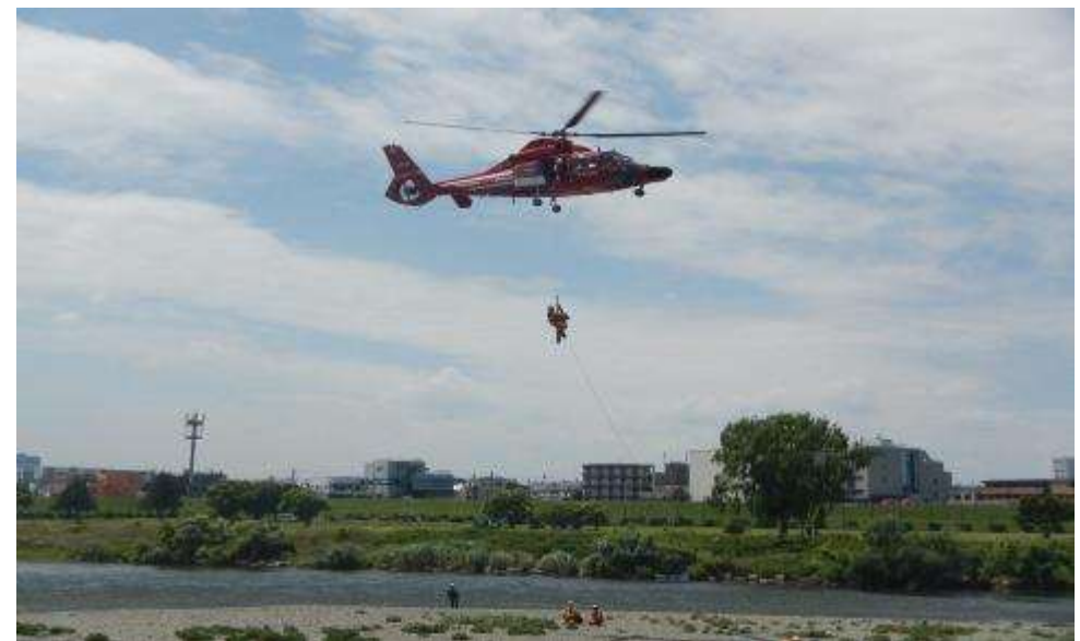
水難救助活動訓練