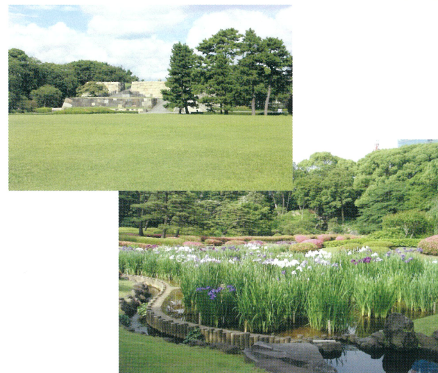
(写真上 : 天守台、下 : 二の丸庭園)

皇居東御苑は、天皇皇后両陛下のお住まいになっている皇居の一角(東側地区)にある皇居附属庭園です。 皇居の由緒ある豊かな自然や歴史に思いをはせながら四季の変化や花々が見られるよう、多様な樹木、草花が植えられ、皇室ゆかりの植物も楽しめます。