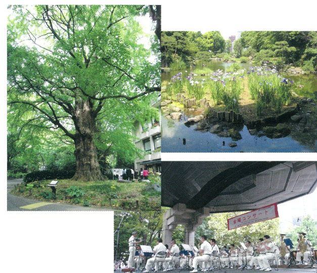
(写真 : 首賭けイチョウ、心字池、小音楽堂)

幕末までは松平肥前守などの屋敷でしたが、日本初の洋風近代式公園として明治36年に開園しました。花壇には、一年中色鮮やかな四季の花が咲き、ビジネス街に勤める人々の憩いの場になっています。