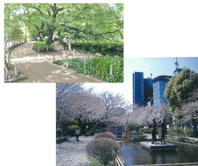
(写真上 : 千鳥ヶ淵緑道 下 : 千鳥ヶ淵公園)

全長約700mの千鳥ヶ淵緑道は、靖国神社や北の丸公園とあわせて都内でも有数のサクラの名所で、お花見の時期には、サクラのトンネルとなり、約120万人の人出があります。多くの動植物が観察され一年を通じて散策、憩いの場として親しまれています。