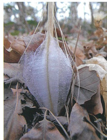
カシワバハグマの氷柱