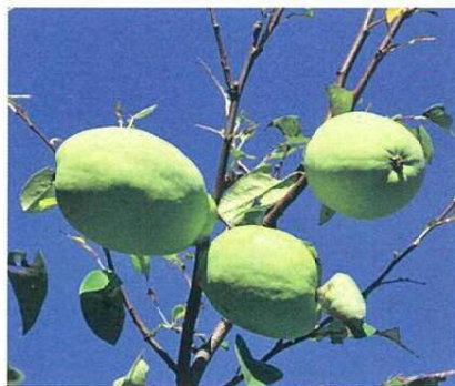
ヒメリンゴ (酸味が強く観賞用) カリン (実は硬く渋い。加工用として利用)