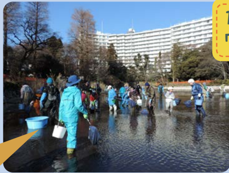
約120人の「おさかなレスキュー隊」が活躍！生きものをレスキューしました。