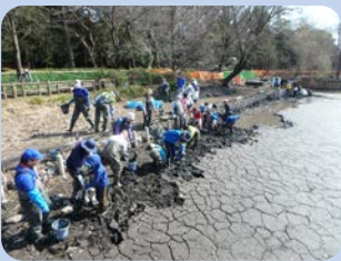
いざ、かいぼり隊のお手伝い！のべ296名が池の中で作業をしました。