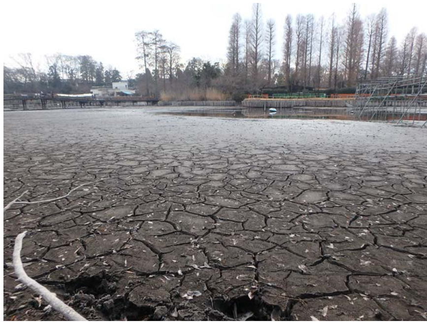
土中深くまで空気が入る、いいヒビ割れだ。

湧水量が多かった今回のかいぼり かいぼり29の排水では、前回のかいぼり以上に湧水に悩まされた。昨年10月の台風による影響で例年より地下水位が高い状態が続いたのだ。湧水が多いのは嬉しいことだが、排水時には悩みのタネになる。それでも予定以上にポンプ台数を増やして干し上げた。底泥にこれほど見事なヒビが入ったのは、かいぼり3回目にして初めてのこと。ヒビ割れすると、土中のチッ素が空気中へ出て行く「脱窒効果」が期待でき、水質改善される。