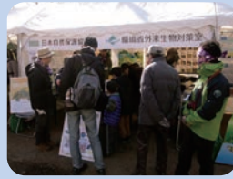
野外ステージ前では14団体がブース出展。池の生きもの展示も。