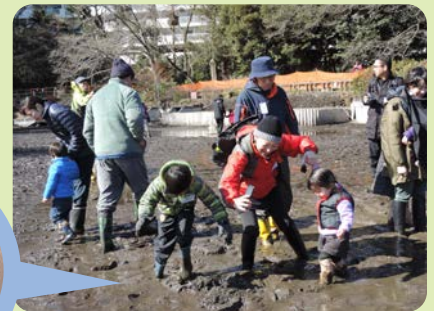
湧水の姿に多くの人が感動！のべ1249人が参加しました。