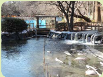
水は井の頭池最下流部→神田川へ