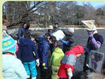
かいぼり隊がガイドを務めました。