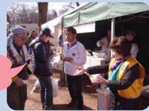
東京吉祥寺ライオンズクラブさん、豚汁&ちゃんこ鍋をありがとうございました！