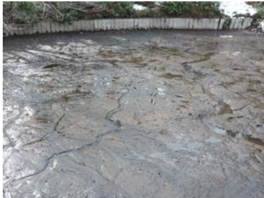
あちこちから染み出した湧水の流れ

2017年12月下旬から始まったかいぼり29は、2018年3月中旬に池へ水を戻し始め、無事に終了した。昨年10月の台風による影響で例年より地下水位が高い状態が続いたのだ。湧水が多いのは嬉しいことだが、排水時には悩みのタネになる。それでも予定以上にポンプ台数を増やして干し上げた。底泥にこれほど見事なヒビが入ったのは、かいぼり3回目にして初めてのこと。ヒビ割れすると、土中のチッ素が空気中へ出て行く「脱窒効果」が期待でき、水質改善される。