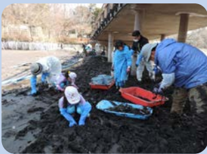
メニューは、浅場づくりとゴミ拾い。七井橋の下はゴミがたくさん！