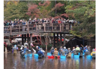
かいぼりの実施状況

「かいぼり作業日」の日程で、各池の生物の捕獲・保護を行います。作業に参加いただくボランティアの方は、事前にかいぼりや生物についての講習会を開催しますので、必ず受講（1回）してください。