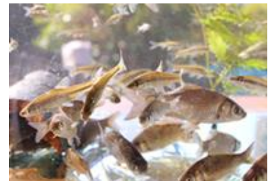
かいぼりで在来種が増加

本件は、「2020年に向けた実行プラン」に係る事業です。 スマート シティ 政策の柱 快適な都市環境の創出