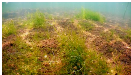
60年ぶりに復活した水草 (イノカシラフラスコモ)