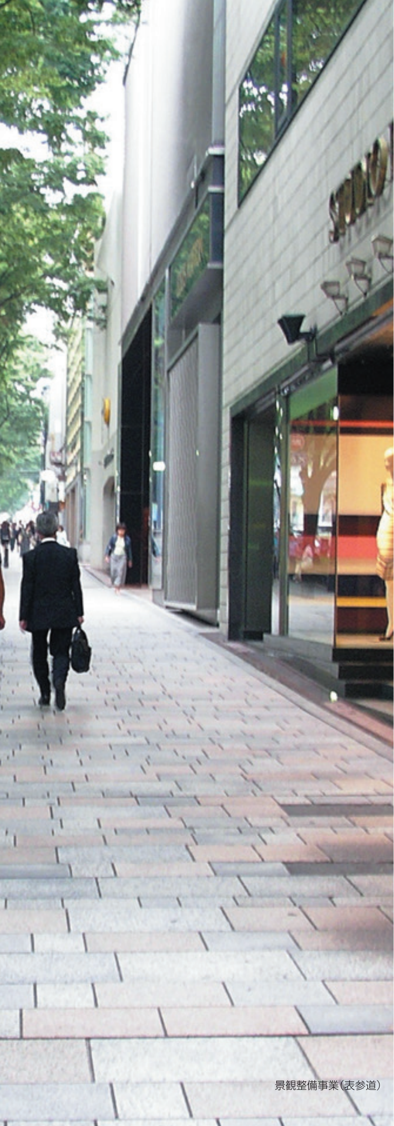
景観整備事業(表参道)