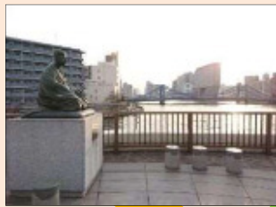
芭蕉庵史跡展望庭園から見た清洲橋