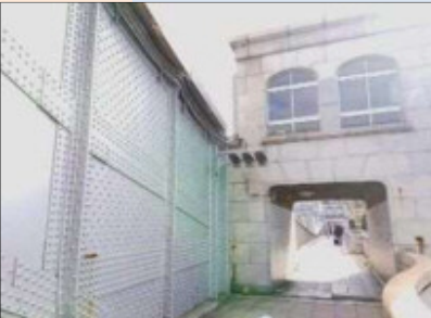
橋が開いていた時の名残り、信号機が残っています。

最寄駅 都営大江戸線 勝どき駅 新島橋方面改札 A4a出口 約550m ※左上に駅付近のご案内がございます。