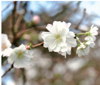
ジュウガツザクラ