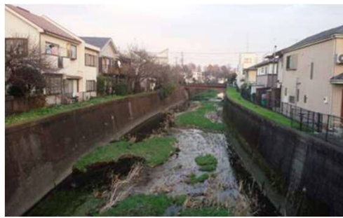
仙川の整備現況 (三鷹市)