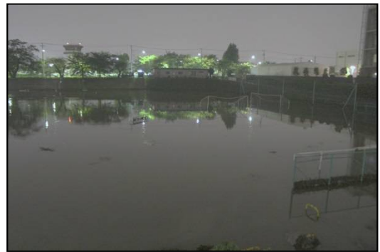
調節池への流入状況 (野川大沢調節池 平成25年8月12日)