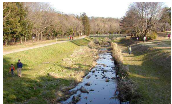
公園との一体整備 (野川・小金井市)

一方、野川は河道内を散歩でき、三鷹市、小金井市付近では、都立公園と河岸の一体整備により、水辺に親しめる河川です。また、多様な生態系を有しており、市民による観察会等のイベントも行われています。ただ、過去には瀬切れが発生するなど、生態系の維持に不可欠な水の確保が大きな課題でもあります。