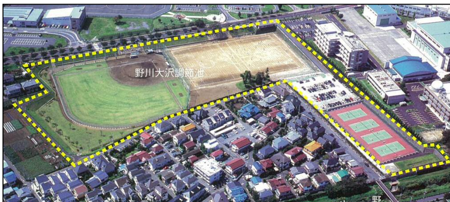
掘込式調節池の例(野川大沢調節池)