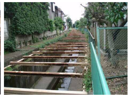
入間川の現況 (調布市)