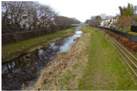
野川の整備現況 (調布市)