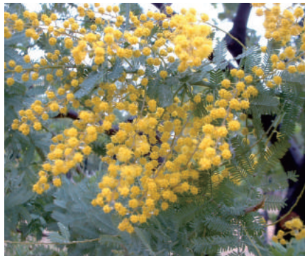
ギンヨウアカシア