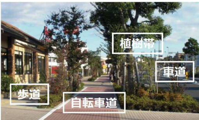
歩道の構造(緑地タイプの例)