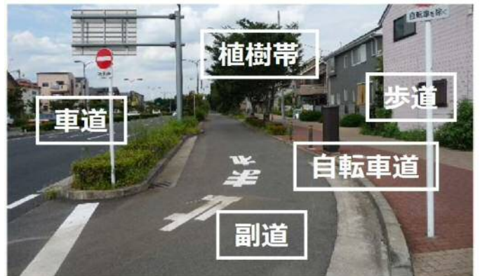
歩道の構造(副道タイプの例)