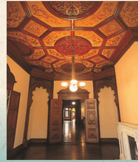
1층 동쪽 객실의 천정에는 일본식으로 자수된 실크가 붙여져 있습니다.