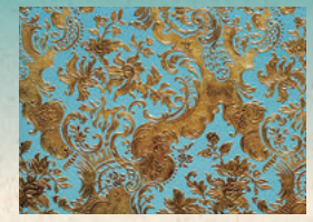
2층 객실의 금당혁지.