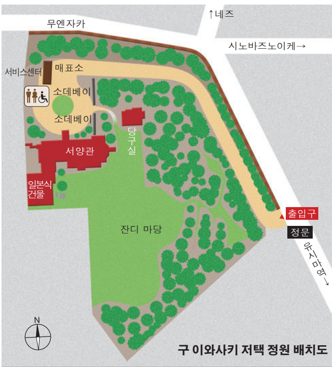
구 이와사키 저택 정원 배치도