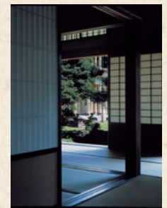
건축 부재 하나 하나에 이제는 입수하기 어려운 목재가 사용되고 있다.