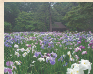
660 株花菖蒲在一側競相開放，將田園風光襯托得更加美麗。

正如光圀號梅里一樣，他非常喜歡梅花。2 月上旬，紅梅、白梅等 30 種梅花競相開放。