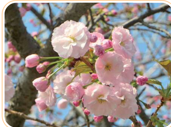
サトザクラ (フゲンゾウ)