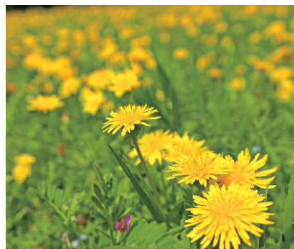
カントウタンポポ