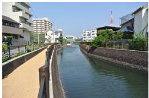
前出護岸による親水空間の創出