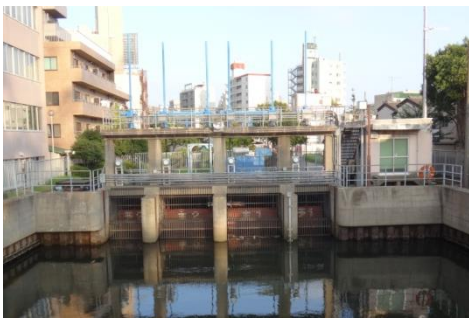
樋管・樋門イメージ (北十間川樋門)

伊勢湾台風と同規模の台風による高潮や最大級の地震による津波に対して安全であることを目標とし、立会川の最下流部に樋門・排水機場を建設します。また、洪水に対しては、下水道幹線（月見橋より上流）から放流される 15\text{m}^3/\text{s} を安全に流すことができる河川の整備を進めます。