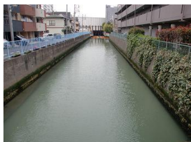
河口付近: 品川区南大井一丁目付近

立会川では、平成14年より月見橋付近からJR総武線の馬喰町駅～東京駅からの地下水を導水しており、1日あたり約1,600m 3 の地下水を流しています。