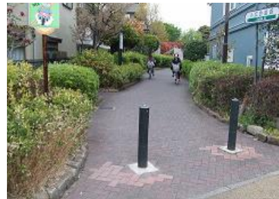
立会道路: 品川区東大井六丁目付近