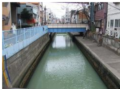
開渠区間: 品川区東大井二丁目付近