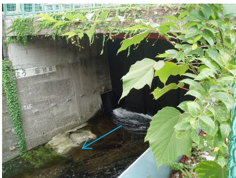
JR総武線馬喰町駅～東京駅からの地下水の導水（品川区）

地下水の導水等により、河川の水質を保持するとともに、水生植物や魚類等の生育・繁殖しやすい河川環境の創出を目指します。