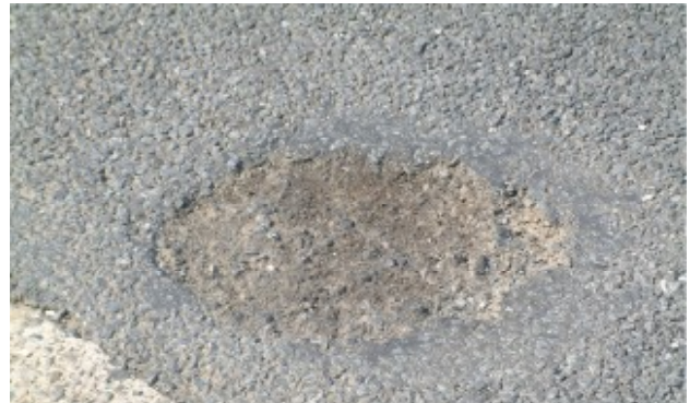
写真-1 ブリージングがポットホールへと進行中

東京都における低騒音舗装は、昭和62年環状七号線で試験施工を開始し平成7年から本格実施され、平成14年4月現在約270km、約350万㎡が施工されている。しかし、低騒音舗装施工箇所では供用後早期にポットホールの発生が散見されるようになった（写真-1）。ポットホール箇所の混合物の共通点として、油臭がありバインダが軟化しカットバックされた状況であった。今回はこのポットホールに注目し、発生の進行実態と原因究明を行った。破損の一原因として油分に起因してブリージング（アスファルトが表面に浮上している状況：写真-2）が発生し、時間とともにカットバックされポットホールに至ると想定した。ポットホール発生の進行実態と原因を検証するために、30箇所について破損進行実態（図-1）を調査し、想定された原因究明及び抑制対策検討の室内試験を行った結果を報告する。