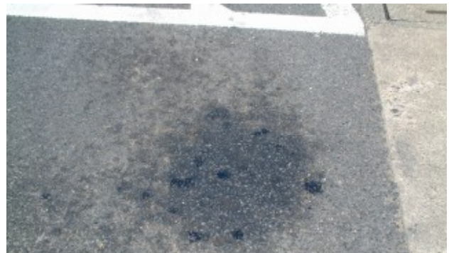
写真-2 面状のブリージング