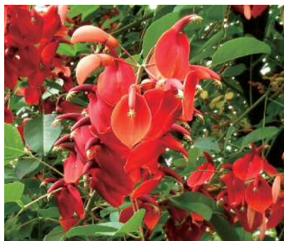
アメリカデイゴ(マメ科)