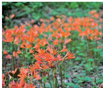
キツネノカミソリ(ヒガンバナ科)