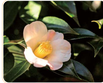
ツバキの園芸品種