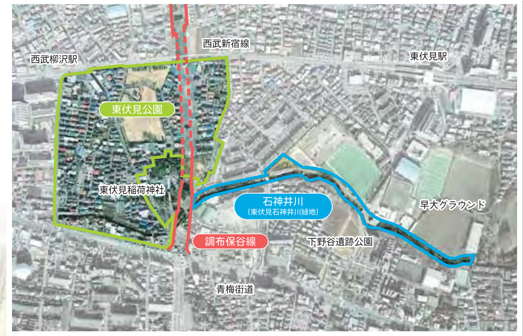
東伏見地区の航空写真（平成18年2月撮影）

道路事業（調布保谷線）・公園事業（東伏見公園）・河川事業（石神井川） 3事業が連携した多摩地区での先行的な取り組み