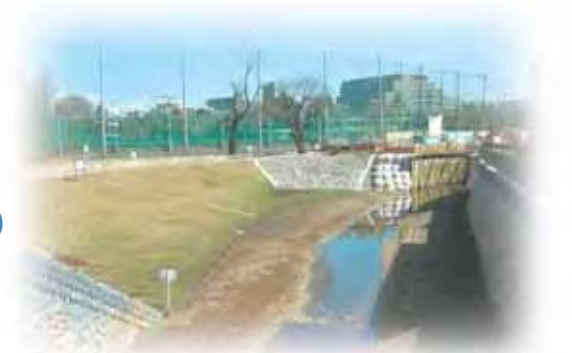
整備済みの石神井川