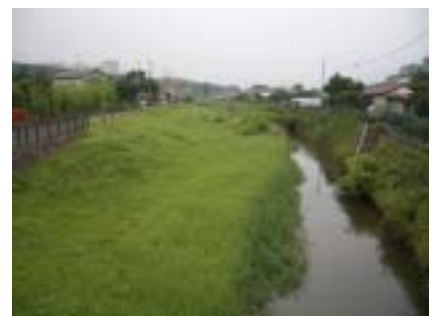
旧河川敷を利用して 緩傾斜護岸を整備 (谷地川)