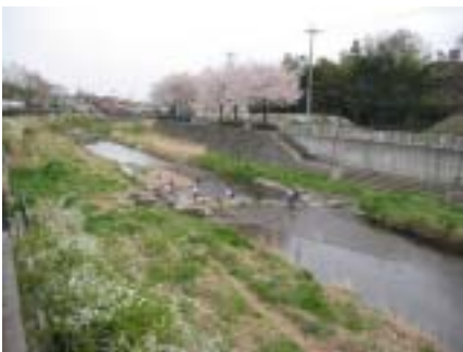
水辺で遊ぶ子供たち (川口川)