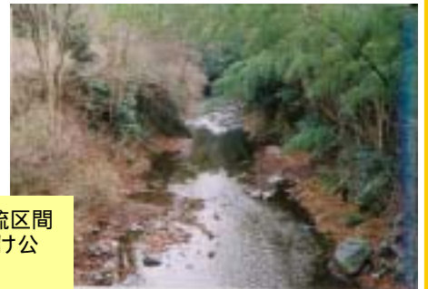
山間部を流れる溪流区間 (浅川：夕焼け小焼け公園上流)