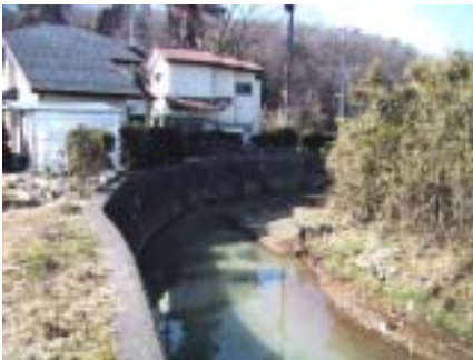
未整備部の谷地川 (八王子市宮下町)

1時間あたり50mm規模の降雨で起きる洪水を安全に流すことのできる川づくりを目標としています。