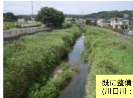
既に整備された区間 (川口川：佐貫橋下流)