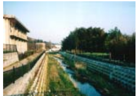
拡幅整備した谷地川 (八王子市加住1丁目)