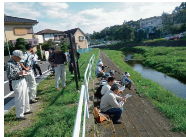
第2回全体会フィールドワーク（川口川）