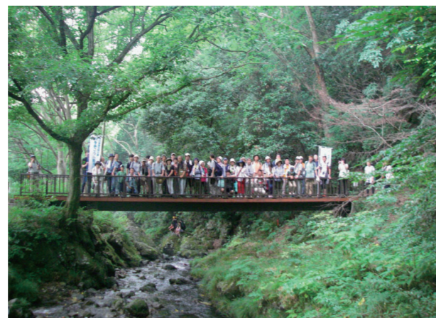
平成25年 南浅川（駒木野公園付近の橋）