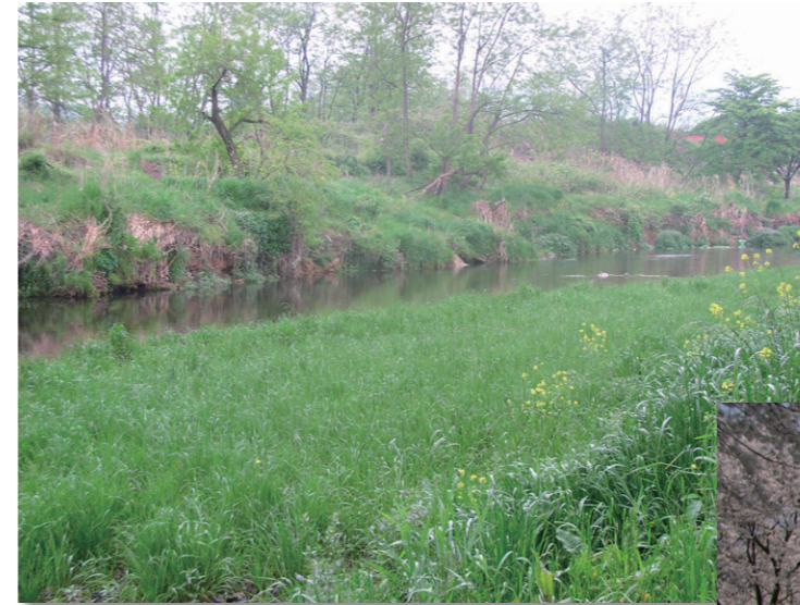
浅川（陵北大橋下流）