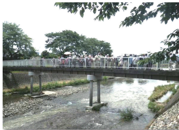
平成24年 南浅川（五月橋）

平成25年7月13日午後 南浅川流域（高尾登山電鉄高尾山駅～JR高尾駅に至る区間）