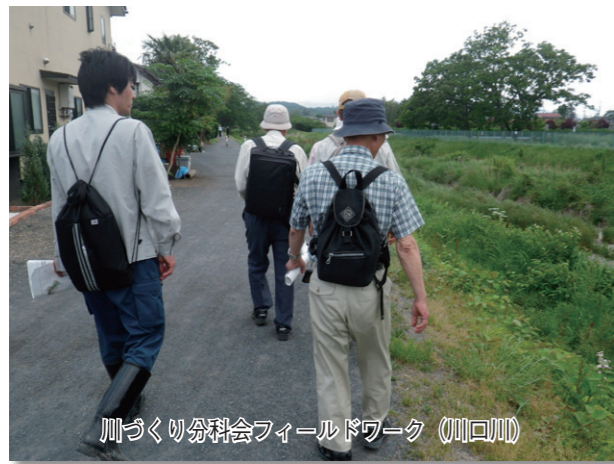
川づくり分科会フィールドワーク（川口川）