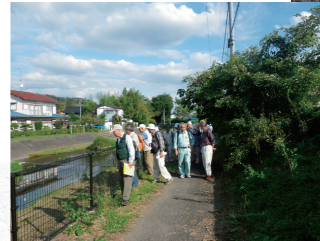
第2回全体会フィールドワーク（川口川）