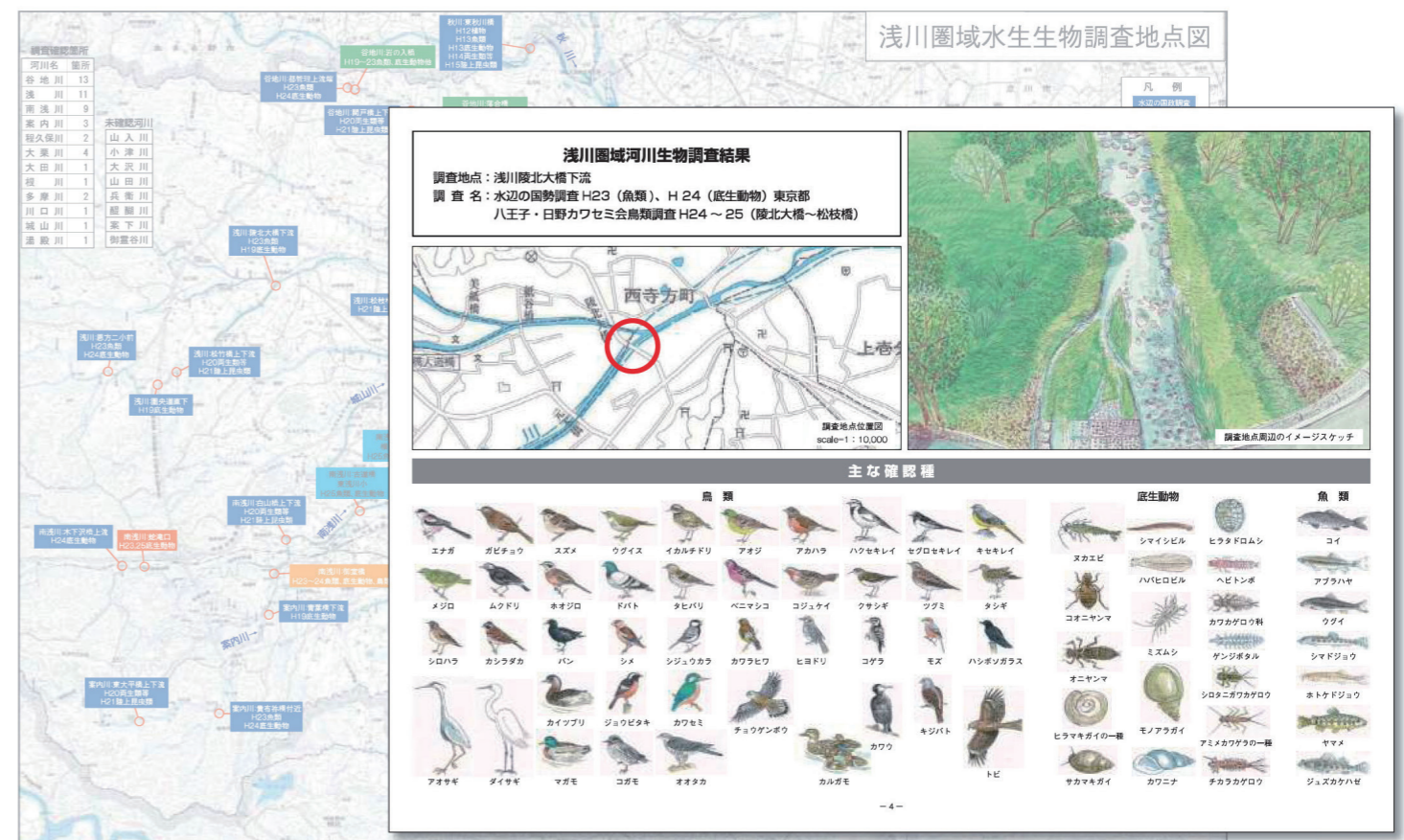
生きものの分科会で作成した浅川流域水生生物調査地点図と詳細図

川口川（高尾橋～山王橋まで）整備計画について、①魚道の形式、②河床洗掘、伏流防止、③河川管理用通路のありかた、④広めの河川区域幅を生かした緩傾斜堤防の護岸整備、⑤豊かな自然を保全した河川整備を提案するなど、自然環境や地域特性に配慮した川づくりに向け提案を行い行政側との共通認識を図りました。引き続き、河川の整備及び工事への提案とともに、その成果を見守るフィールドワークを多く取り入れた活動を進めていきます。