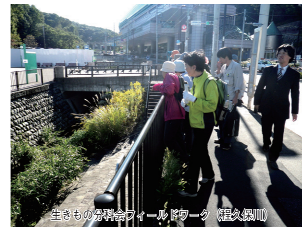
生きものの分科会フィールドワーク（程久保川）