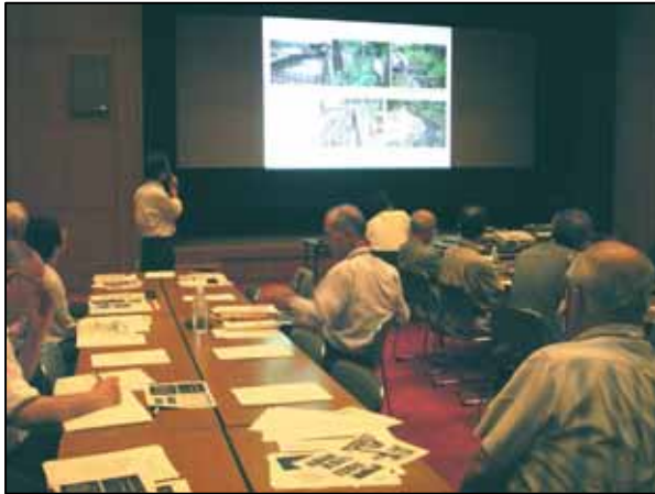
水環境分科会の活動報告