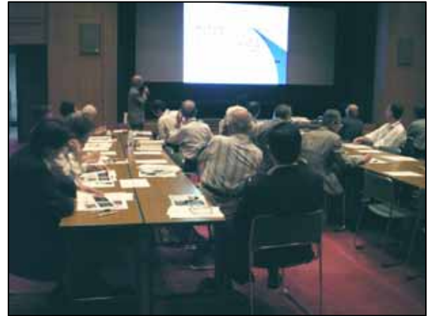
生きもの分科会の活動報告