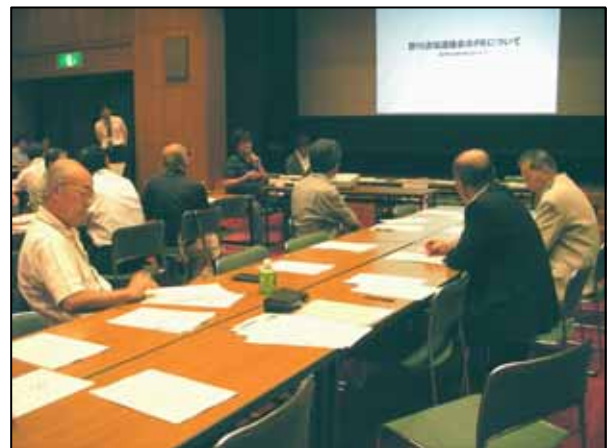
副まとめ役によるウェブサイトの説明