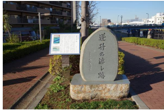
逆井の渡し跡の碑と説明板