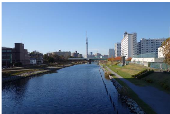
灯籠流しが行われる水域