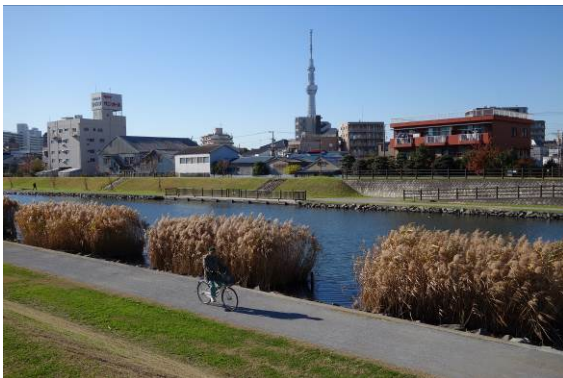
堤防整備と川沿いの遊歩道