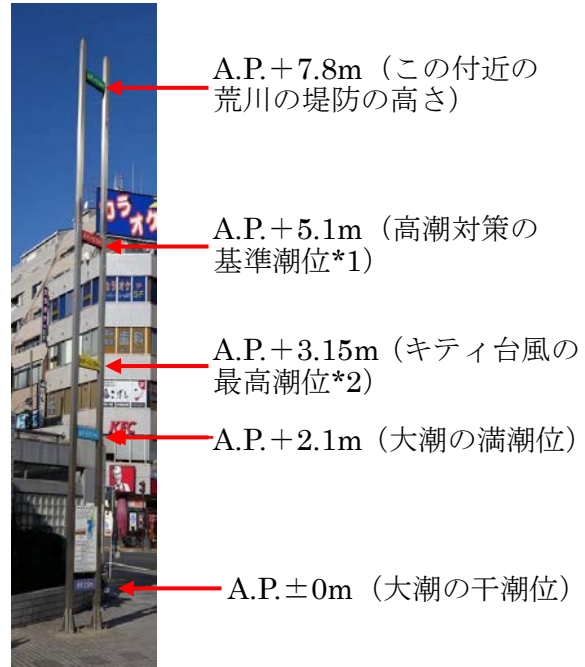
平井駅前の水面高表示板