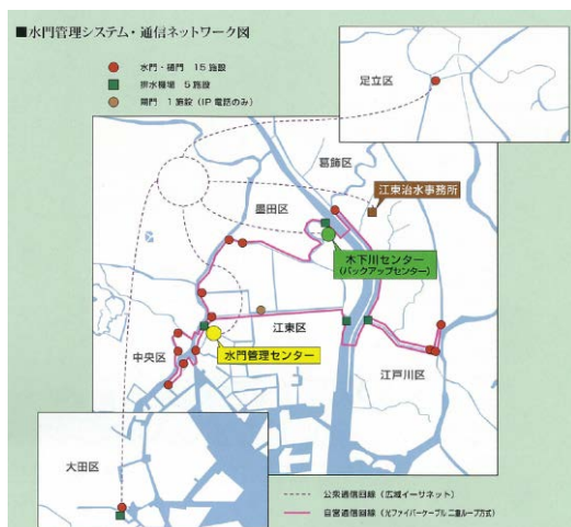
水門管理システム・通信ネットワーク図