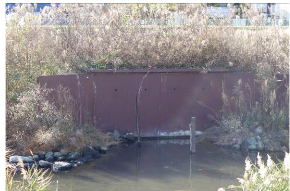
カワセミの営巣を促す環境整備