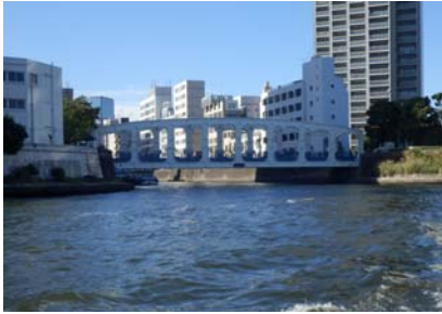
⑧豊海橋（日本橋・隅田川合流点にかかる橋）