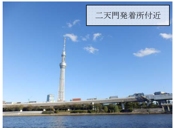
二天門発着所付近