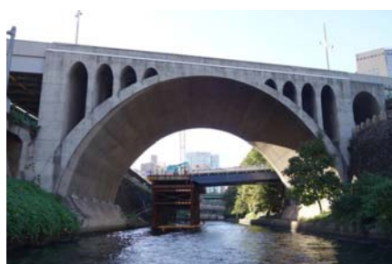
⑫江戸時代に開削された神田川（聖橋）