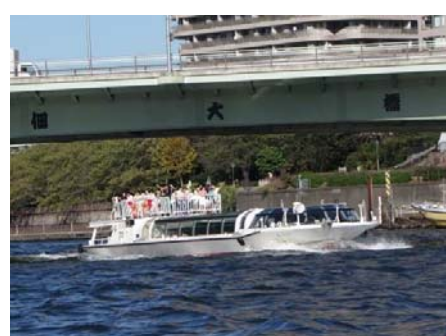
すれ違う水上バス