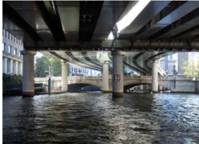
⑩日本橋（河川上空の高速道路）