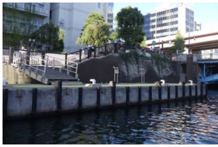
⑭秋葉原駅近くの和泉橋防災船着場