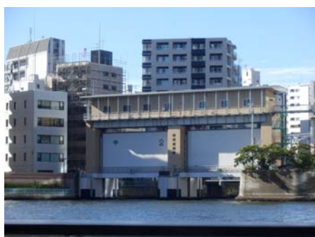
⑦亀島川水門（亀島川からの合流）