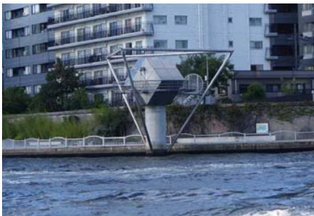
⑤霊岸島水位観測所