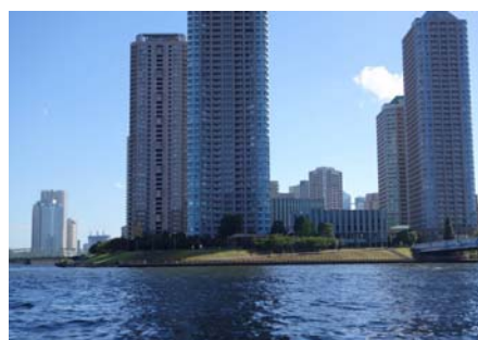
⑥スーパー堤防（大川端地区）