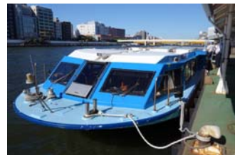
視察で使用した「かわせみ」号