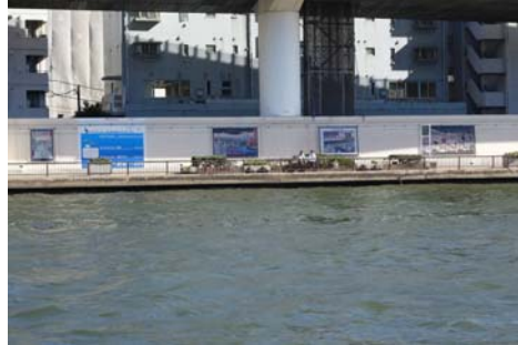
②テラスギャラリー