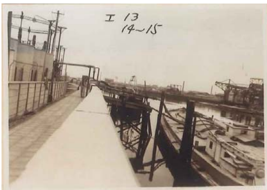
昭和 41 年 旧平井 3 丁目 ライオン油脂工場