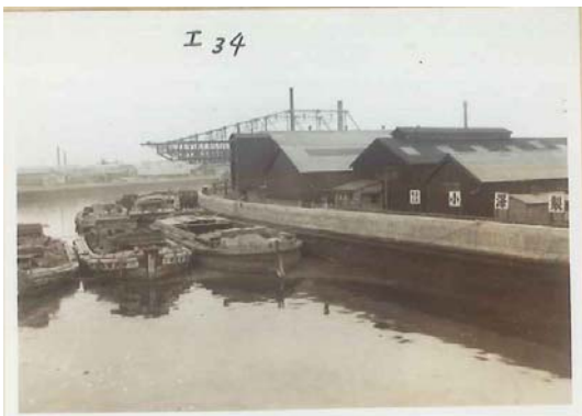
昭和 41 年 旧平井 4 丁目 旧小沢製線所