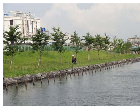
現ライオン油脂工場(平井 7 丁目)