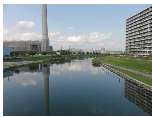
現平井 7 丁目（製線所跡地に建つマンション）