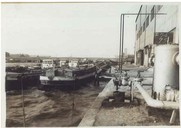
昭和 41 年 旧小松川 1 丁目 東京日産化学