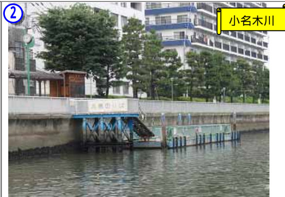
小名木川・高橋船着場