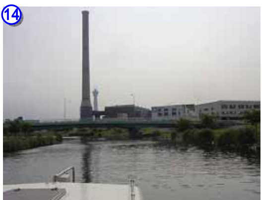
墨田区の清掃工場とスカイツリー