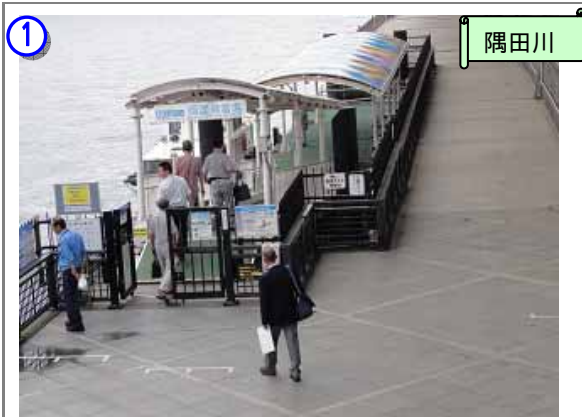
隅田川・両国船着場より乗船