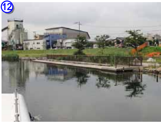
平井地区の船着場