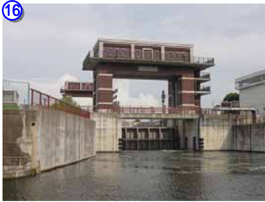
荒川ロックゲート