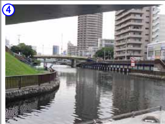
小名木川より横十間川に入る