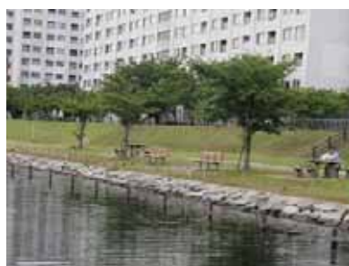
旧中川整備・利用状況