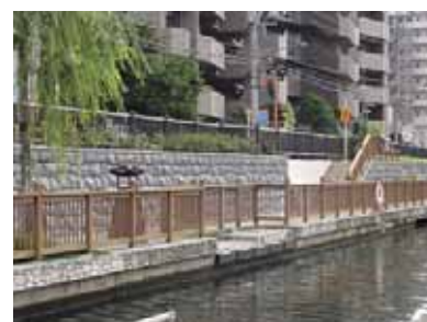
小名木川・塩の道整備状況