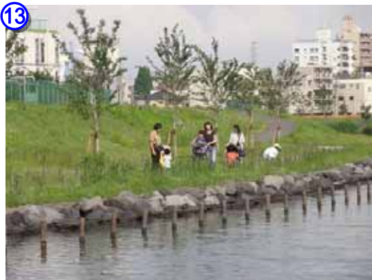
植栽された桜と散策利用