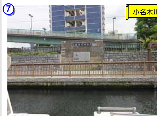
再び小名木川へ。残置した旧護岸