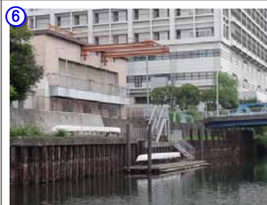
横十間川にある墨田区艇庫