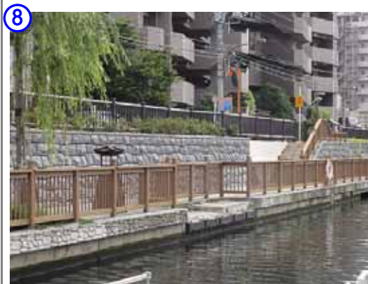
塩の道の整備箇所