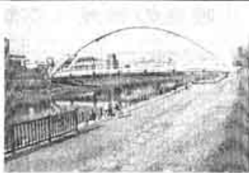
■旧中川（ふれあい橋）