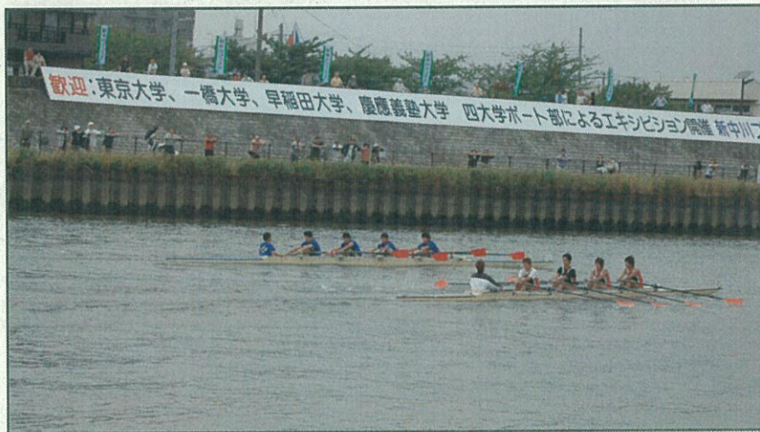
四大学ボート部によるエキシビジョン