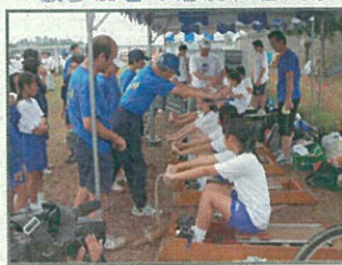
一般参加者の漕艇練習風景