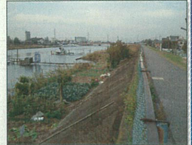
不法耕作・不法係留①