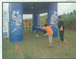
キックターゲット