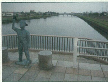
全長:78キロ 江戸区内延長:60キロ 川幅:111m 水面幅80m