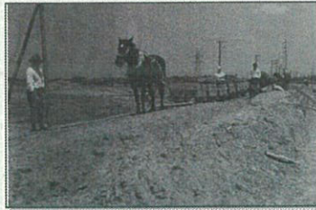
工事の様子① (馬で土を運んでいる)