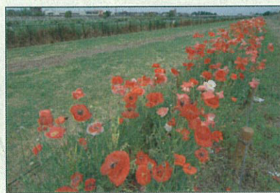
小学校の総合学習用花壇