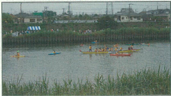
カヌー・Eボート・ドラゴンボート体験