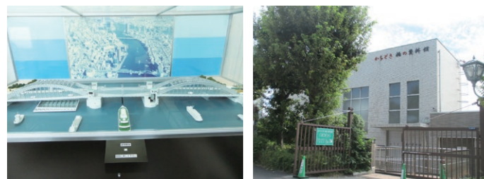
【動く勝鬃橋の模型】