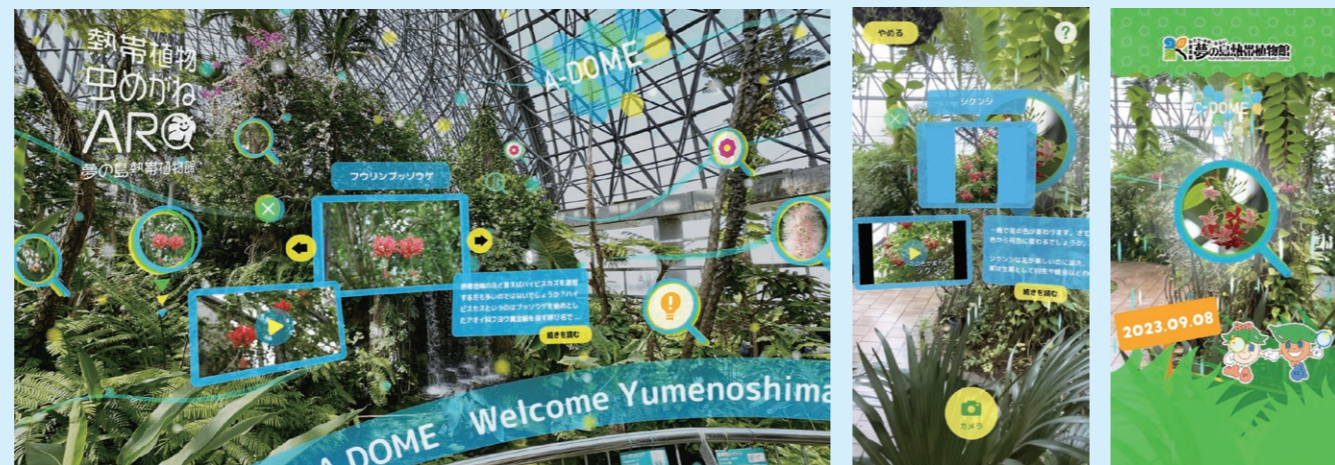
アプリのイメージ

虫めがねをタップすると、植物の詳細情報をはじめ、貴重な写真や映像を見ることができます。熱帯植物の美しさと魅力、そして最新の技術が結集した新たな鑑賞体験を、どうぞお楽しみください！