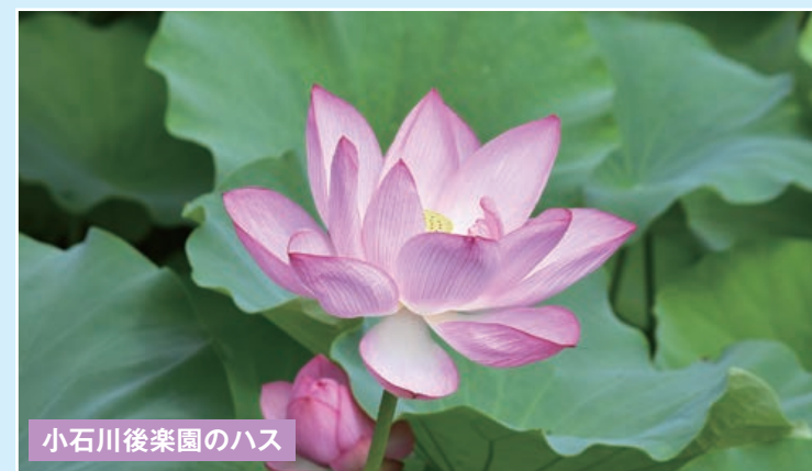
小石川後樂園のハス