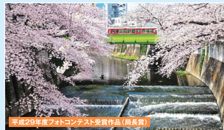
平成29年度フォトコンテスト受賞作品(局長賞)