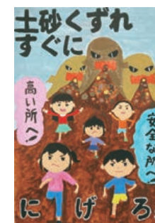
令和4年度建設局長賞受賞作品(抜粋)

応募作品にタイトル、学校名、学年、氏名を明記の上、9月15日(金)(消印有効)までに郵送で「土砂災害防止に関する絵画・作文」担当(〒163-8001 東京都新宿区西新宿2-8-1 東京都建設局河川部指導調整課)へ。