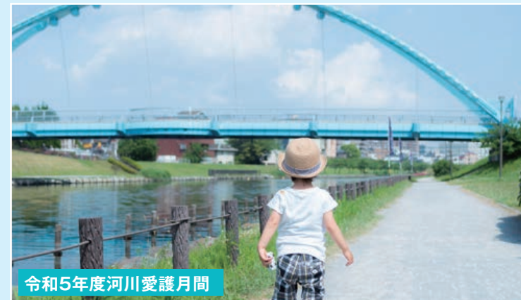
令和5年度河川愛護月間

特別特集 夢のみちイベント開催! ～8月は道路ふれあい月間!関連行事のお知らせ～ 夢のみち2023 親子体験ツアー参加者募集 「無電柱化の日」フォトコンテストを開催しました