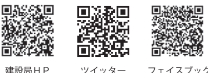
建設局HP ツイッター フェイスブック

登録番号 (4) 57 ●発行/令和5年2月 ●印刷/光栄印刷(株) ●制作協力/パール商事(株)