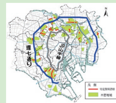
震災時に特に甚大な被害が想定される木密地域(整備地域 約6,500ha(緑色箇所))

都は、首都直下地震の切迫性などを踏まえ、木密地域における都民の生命と財産を守るため、木密地域を燃え広がらない・燃えないまちへと造り変えています。