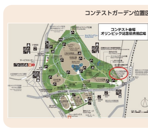
コンテストガーデン位置図