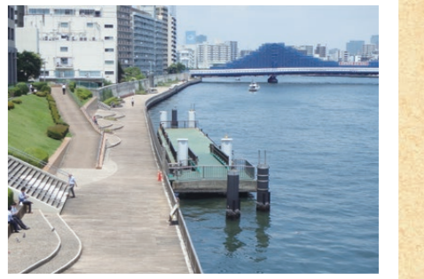
写真:隅田川の箱崎町防災船着場

※防災船着場とは:大規模災害発生時に人や物資の輸送経路として河川を活用する際、人や物資等が陸に乗降するための施設です。防災船着場のうち、一般開放しているものは、平常時に観光等の目的で利用することも可能です(要予約)。