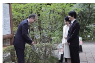
両殿下ご視察の様子