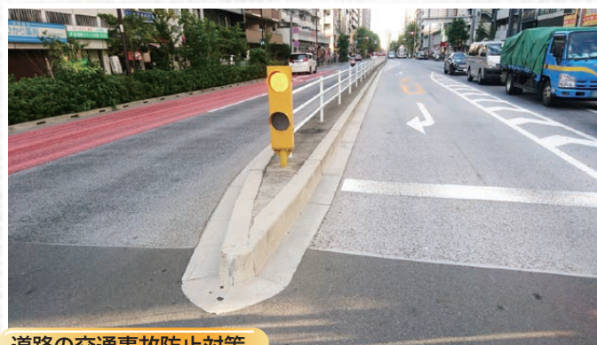
道路の交通事故防止対策