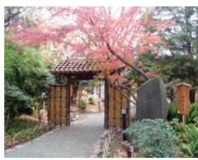
国指定名勝・史跡