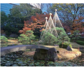
特別史跡・特別名勝