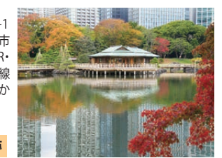
特別名勝・特別史跡