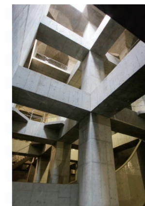
黒目川黒目橋調節池