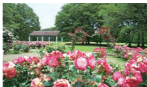
10月のフラワーガーデン