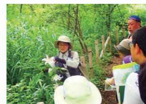
パークレンジャーのガイドウォーク