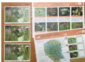
ポストカードとミニ図鑑付きマップ