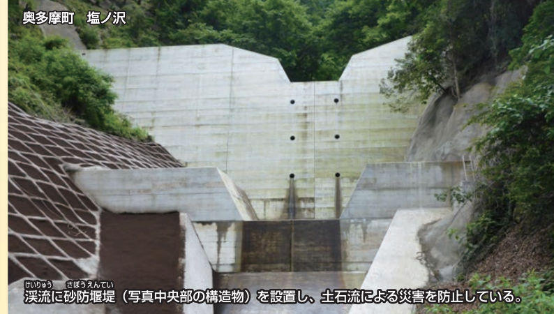
渓流に砂防堰堤（写真中央部の構造物）を設置し、土石流による災害を防止している。