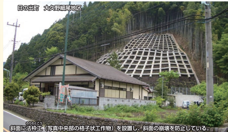
斜面に格字状工作物（写真中央部の格子状工作物）を設置し、斜面の崩壊を防止している。