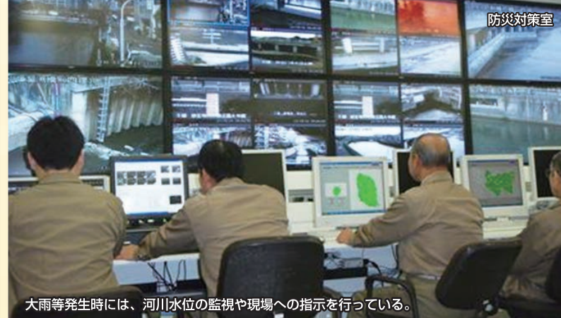
大雨等発生時には、河川水位の監視や現場への指示を行っている。