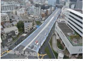
放射第25号線(新小川町)

平成28年3月13日(日)、東京都が整備を進めている東京都市計画道路放射第25号線のうち大久保通りから目白通りまでの約280mの区間を交通開放しました。 これにより、自動車交通の円滑化や防災性の向上が図られるとともに、自転車走行空間の整備や無電柱化により、安全で快適な空間が新たに創出されました。