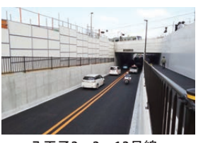
八王子3・3・13号線(打越町土入立体)

平成28年3月26日(土)、東京都が整備を進めている八王子都市計画道路3・3・13号下柚木片倉線の、JR横浜線との立体交差部(アンダーパス)約440mの区間を交通開放しました。 これにより、JR横浜線の打越踏切が廃止され、自動車交通の円滑化が図られました。