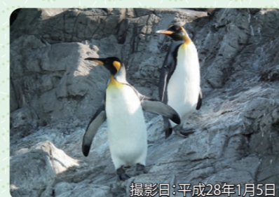
撮影日:平成28年1月5日

平成27年4月に和歌山県のアドベンチャーワールドから葛西臨海水族園に来たオウサマペンギンのオス2羽です。ぜひ会いに来てください。