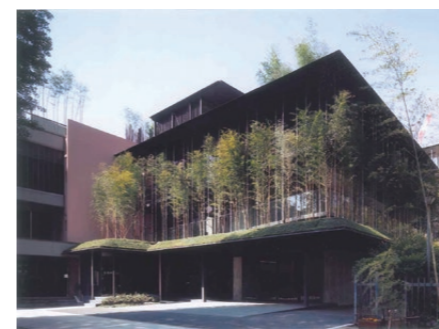
民有地の緑化助成例

今年度の緑化助成事業を募集しています。企業・民間施設を緑化する事業に対し工事費の一部を助成します。応募締切は11月20日まで。詳しくは「東京都都市緑化基金」のホームページまたは下記問い合わせ先までお気軽にご連絡ください。