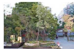
2014年東京都知事賞 受賞作品

問い合わせ先 公益財団法人東京都公園協会公園事業部内 日比谷公園ガーデニングショー実行委員会事務局 担当:久間・花房 TEL:03-3232-3097