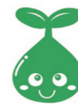
マスコットキャラクター ふたばちゃん

東京都都市緑化基金は、都民の皆さまと一緒に東京の緑を増やすことを目的として、昭和60年に東京都公園協会内に作られ、今年で30周年を迎えることができました。