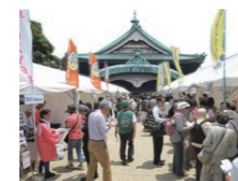
「災害食グランプリ」イメージ写真

都立横網町公園では、一昨年関東大震災90周年を記念して開催した「首都防災ウィーク」を、第3回目となる今年も開催いたします。今年は「大震災と食」をテーマとして各種講演会やシンポジウム、イベントを予定しています。特に今回は「災害食グランプリ」を開催します。いざというとき役立つ災害食を実際に食べ、おいしさを競います。