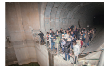
神田川・環状七号線地下調節池