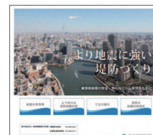
ホームページトップ画面

○「より地震に強い堤防づくり」については建設局のホームページからご覧いただけます。 http://www.kensetsu.metro.tokyo.jp/kasen/teibou/index.html