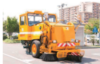
ロードスイーパー

問い合わせ先・申込み先 〒163-0720 新宿区西新宿2-7-1 小田急第一生命ビル20階 (公財)東京都道路整備保全公社「夢のみち」事業事務局 親子体験ツアー担当 TEL:03-5381-3380 HP: http://www.tmpc.or.jp/yume/tour/