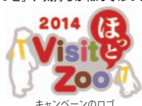
キャンペーンのロゴ

昨年好評だった冬の動物園・水族園の魅力を満喫していただく「ほっと」なキャンペーンを今年も開催します。活気あふれる「ほっと」、話題の「ほっと」、気持ちが和んでほっとする「ほっと」など、冬の動物園・水族園には、「ほっと」な場所がたくさんあります。このような場所を「ほっとポイント」として紹介するとともに、期間中動物園・水族園を巡るスタンプラリーやフォトコンテストなどのイベントを開催します。