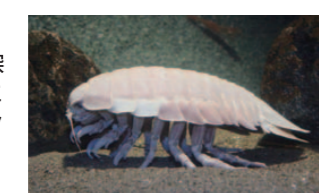
深海にすむ巨大なダンゴムシの仲間ダイオウグソクムシ

【葛西臨海水族園】 冬は深海生物の採集シーズン。深海生物展示が一段と充実するのがこの時期です。人気のダイオウグソクムシはご覧になりましたか?