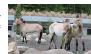
世界で唯一の野生馬モウコノウマ

【多摩動物公園】 昨年、新しくオープンした「アジアの平原」。動物たちも展示施設になれ、多摩動物公園で今一番「ほっと」な施設です。