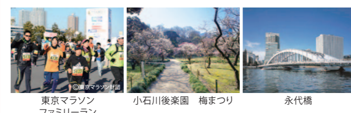
東京マラソンファミリーラン

東京の魅力の世界に発信するイベントとして「東京マラソン2014」が2月23日(日)に開催されます。日比谷通りなどマラソンコースの大半は、東京都が管理する都道です。ランナーは普段走れない道路の真ん中から街並みを楽しみながら駆け抜けられます。 コース周辺では、首都圏の防災機能を担う東京臨海広域防災公園で、「東京マラソンファミリーラン2014」など関連イベントが催され、文化財庭園の小石川後楽園では梅の花が見頃となるなど、公園や庭園の魅力を感じられます。 コースと平行する隅田川には、国の重要文化財に指定された清洲橋・永代橋・勝鬨橋など著名な橋梁が架かり、水辺と調和した東京らしい都市景観を形成しています。 是非この機会に東京のまちの魅力に触れ、自分だけのお気に入りスポットを見つけてください!