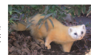
黒い顔から白い顔に変わるホンデテン

【井の頭自然文化園】 冬毛に生え変わったホンデテン、ふかふかの毛をまとったニホンカモシカ、繁殖羽となったオンドリなど、冬支度した動物たちを見に来てください。