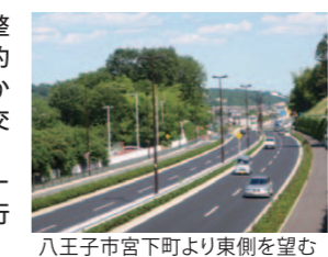
八王子市宮下町より東側を望む

東京都が圏央道アクセス道路として整備を進めてきた新滝山街道（全長約7.0km）は、平成25年3月に高尾街道から谷野街道までの区間（約2.6km）を交通開放し、全線開通となりました。これにより、圏央道あきる野インターチェンジへのアクセス性が向上し、並行する国道411号の渋滞が緩和しました。