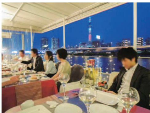
東京スカイツリーと隅田川

応募条件等の詳細な内容はホームページでご確認ください。 http://www.kensetsu.metro.tokyo.jp/kasen/kawaterasu/