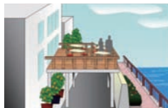
かわてらす設置イメージ

応募条件等の詳細な内容はホームページでご確認ください。 http://www.kensetsu.metro.tokyo.jp/kasen/kawaterasu/