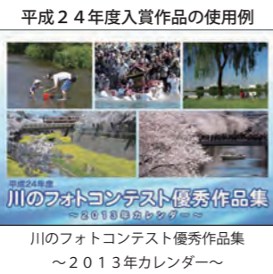
平成24年度入賞作品の使用例 川のフォトコンテスト優秀作品集 ~2013年カレンダー~