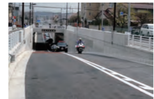
旧甲州街道側より南側を望む(平成25年3月23日撮影)

これにより、多摩地域の道路ネットワークが強化され、交通の円滑化が図られるとともに、沿道地域の利便性や防災性の向上が図られます。