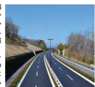
八王子市宮下町より同市戸吹町方面を望む(平成25年3月5日撮影)

新滝山街道は、圏央道あきる野インターチェンジへのアクセス機能及び国道411号のバイパス機能を持つ道路です。今回の開通により、国道411号の渋滞が緩和されるとともに、圏央道へのアクセス性が向上し、都県を越えた人と物の交流に大きく貢献します。