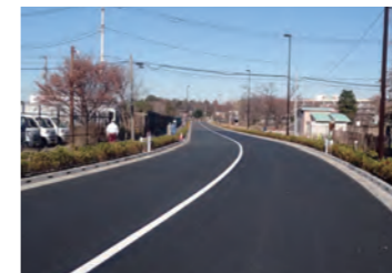
人見街道側より水車通り方面を望む (平成24年12月13日撮影)

また、災害時の避難場所指定されている都立武蔵野の森公園や三鷹市大沢総合グラウンドへの避難路が確保されるなど、防災性の向上が図られます。