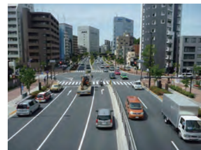
環状6号線（山手通り）の整備

公共事業を取り巻く環境が厳しさを増している中、建設局の果たす役割は極めて大きく、世界に誇れる都市へと進化させるためにも職員一丸となってこれらの事業に取り組んでいきます。