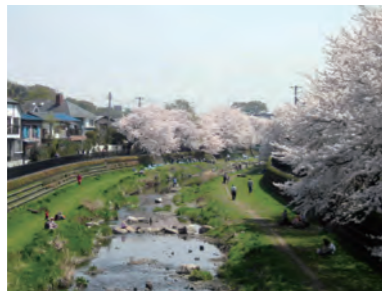
中小河川の整備（野川・調布市）