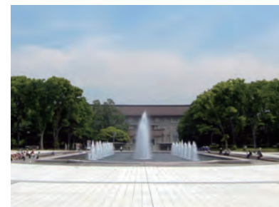
上野恩賜公園の再生整備